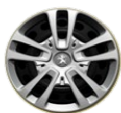
16" Svart stålfälg, hel navkapsel "Spyke"