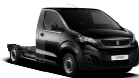
Svart Perla Nera