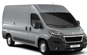
Grå Aluminium (Metallic)