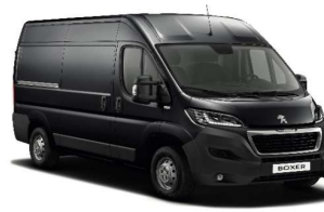
Grå Graphito (Metallic)