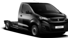
Svart Perla Nera