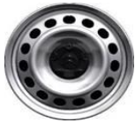
Grå stålfalg, halv navkapsel