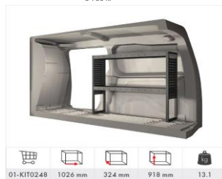
Inredning höger sida med 2 hyllplan (Tillval L2) 5 700 kr