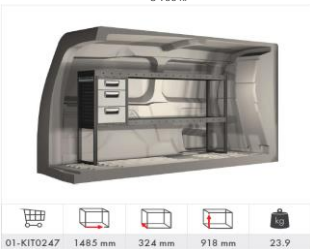
Inredning vänster sida med 2 hyllplan, 1 hurts med 3 lådor (Tillval L3) 8 900 kr