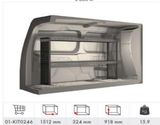
Inredning vänster sida med 2 hyllplan (Tillval L2) 5 600 kr