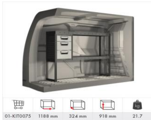
Inredning vänster sida med 2 hyllplan, 1 hurts med 3 lådor (Tillval L1) 7 900 kr