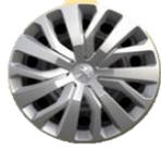
Svart 16" stålfalg, hel navkapsel "Rakiura"