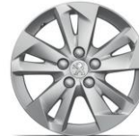
16" Aluminiumfalg "Taranaki"

*Inbusiness L1 75hk & Inbusiness L1 100hk är 15" Fälgar övriga är 16"