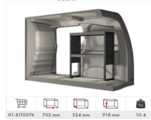
Inredning höger sida med 2 hyllplan (Tillval L1) 5 500 kr