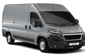
Grå Aluminium (Metallic)