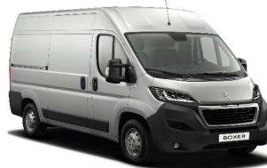
Grå Artense (Metallic)