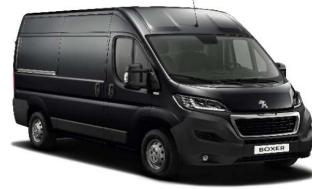
Grå Graphito (Metallic)