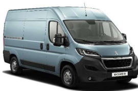
Blå Lago Azzuro (Metallic)