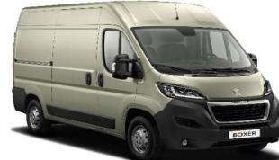
Grå Fer (Metallic)